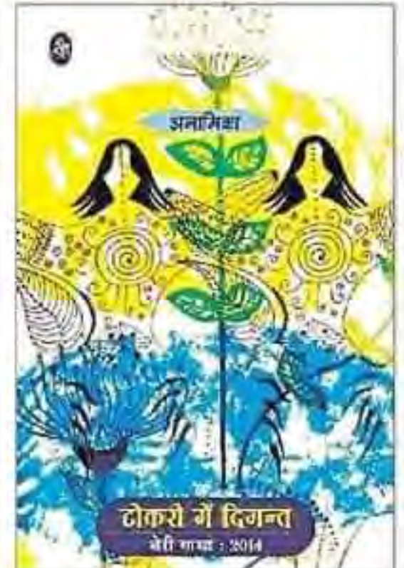
पुरस्कृत कविता संग्रह 'टोकरी में दिग्न्त : थेरी गाथा : 2014' पुस्तक का आवरण पृष्ठ।