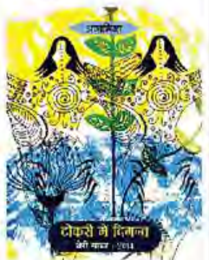
अनामिका की पुरस्कृत पुस्तक

स्वीकार्य भी। आज के स्त्री लेखन की सुपरिचित धारा से अलग यह एक नई कल्पनात्मक सृष्टि है, जो अपनी पवित्रियों को पाठक पर धोपने के बजाय उससे बोलती-बतियाती है। यह काव्य-कृति एक नई काव्य-भाषा की प्रस्तावना है, जो व्यंजना के कई बन्द पाठ दरवाजों को खोलती है और यह सब कुछ घटित होता है एक स्थानीय केंद्र के चारों ओर। नाम पर सिंह का कहना है कि अनामिका के रचना लोक में जीते-जागते जानदार चित्र सामने आते हैं। स्त्री-मुक्ति के नए आयाम यहां खुलते हैं।