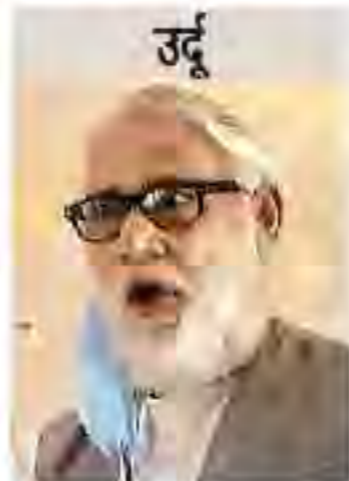
उर्दू हुसैन-उल-हक। (उपन्यास: अमावस का ख्वाब)