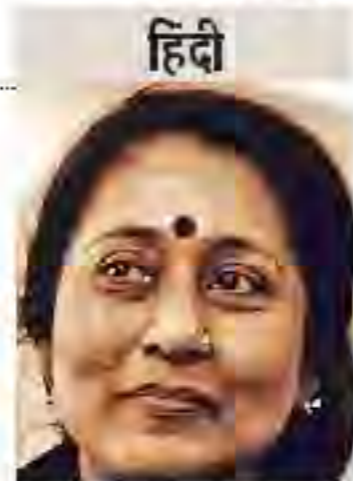
हिंदी अनामिका। (कविता संग्रह: टोकरी में दिगंत: थेरीगाथा)